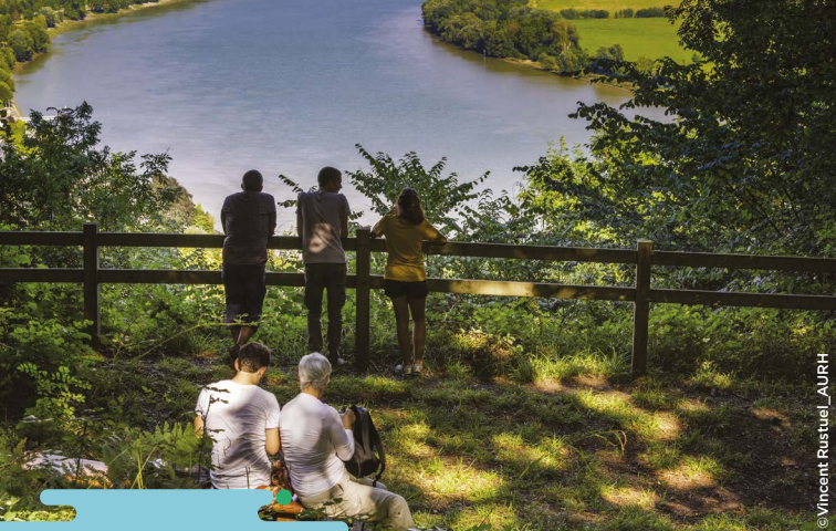
Bords de Seine

www.fidelamemoire-bolbec.fr - 06 38 39 10 17