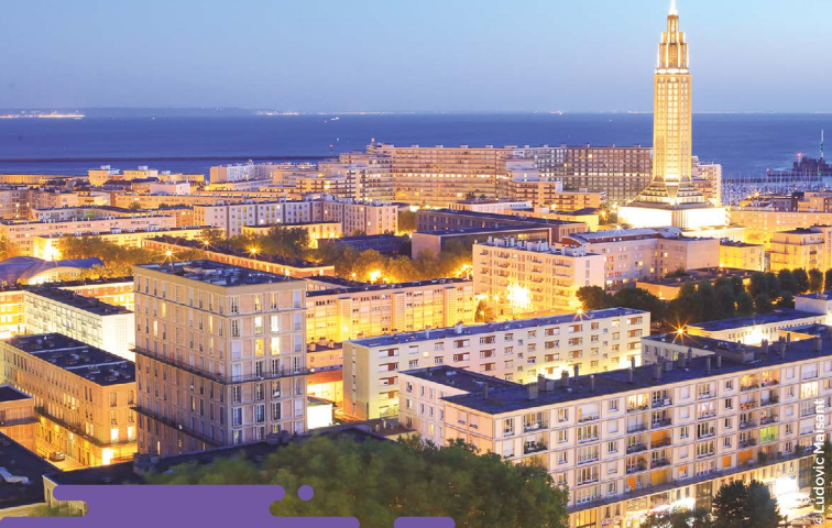
Centre reconstruit du Havre