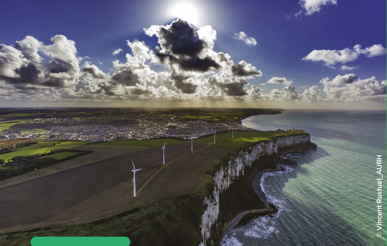
Cap Fagnet – Fécamp

www.beuzeville-tourisme.com - 02 32 57 72 10