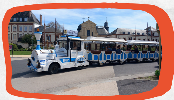
Le petit train de Lisieux