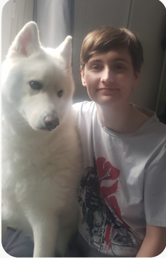
Robin et Phantom