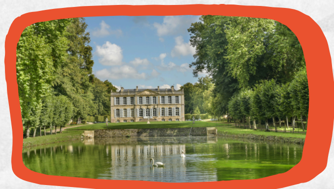
Jardins de Canon