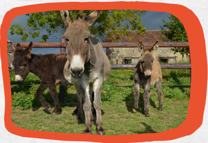
Au Paradis des ânes du Pays d'Auge