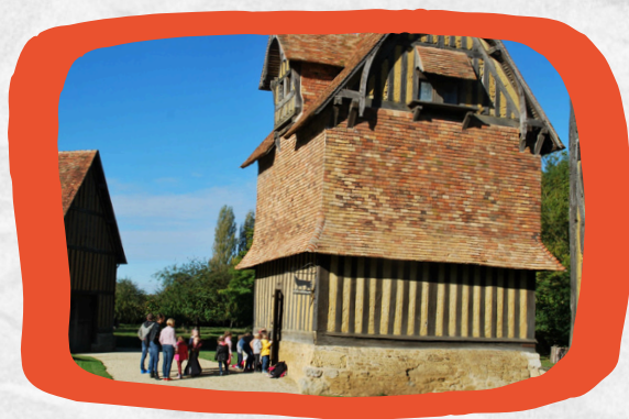
Château de Crèvecœur