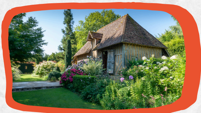
Jardins du Pays d'Auge